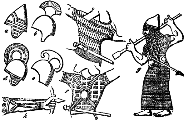
געוועהר פון אמאליגע צייטען

אוועק און נאָט ווייס אויב איך וועל צוריק קומען. דאָס פּאַלס האָט זיך שטאַרק צואווייגט. עמיהוד האָט גע- וואָרפען דעם לעצטען בליק אויף זיין הויז, וואו ער האָט